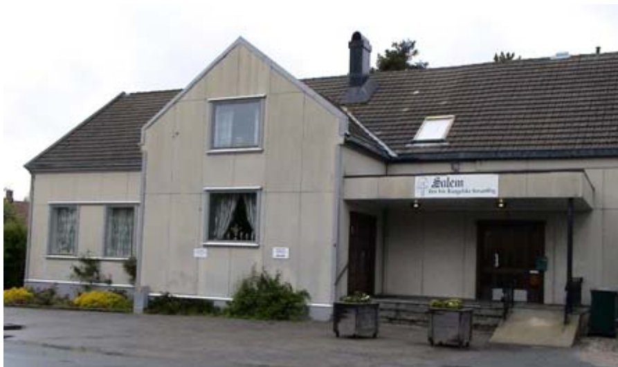
BILDE: Menighetslokalet Salem i dag.